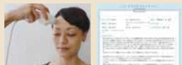
専用の高解像度カメラで撮影した表皮層や真皮層の画像を、スキンケアコンサルタントへ送り肌診断を行います。

キーワードは、「健康肌」にすること ドクターピュアラボの赤ちゃん肌づくりは、つまりトラブル肌を「健康肌」へ生まれ変わらせることにあります。それぞれの働きを持たせた14アイテムをお客様の肌状態に合わせて使い分け、ファンデーションもいらない素肌をつくりあげます。 その効果の実績は8000人以上あり、「効果」が求められるサロン経営に大きな力となります。「紫外線による肌トラブル」や「年齢からくる肌トラブル」など一気に改善できるスキンケアです。