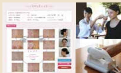
お客様お一人おひとりの電子カルテを作成、安心安全に美肌再生を行えるようサポートします。