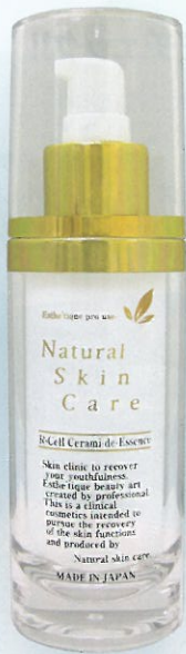
リセル セラミー・ド・エッセンス 内容量: 60ml 標準小売価格: 6,930円(税込)

EGF・FGFなど細胞再生因子による細胞増殖には培養液が必要だが同社の研究により証明された。胎児を育てるには羊水が不可欠ことからわかるように、細胞の成長には培養液が必須であり、そうした新しい着眼点から生まれたのが、この「羊水」培養液によって肌を再生し、育てていく「リセル セラミー・ド・エッセンス」だ。肌の弱酸性の保護皮層は外部からの雑菌のタンパクを分解し肌を守っている。EGF・FGFのヒトペプチド成分(種)やその為のエッセンス(畑)は羊水様成分が最適であるとされています。どちらもペプチド成分が主であり「肌の表皮皮層」等の外因の影響を受けやすく分解されやすい、羊水様成分を維持するために、ナノ化し二重のリポソームカプセル皮膜に包み込んであるのが大きな特徴。その結果すべての成分がしっかり肌に作用する。有効成分をただ塗布するだけでなく成長させていくという、まったく新しい観点からできたスーパー美容液だ。有効成分の効果を最大限に引き出すための工夫が凝らされており、細胞再生(畑)エッセンスとして肌の若返りに効果が期待できる。