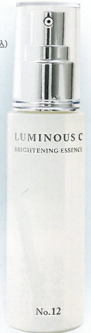
ルミナスC 内容量: 50ml 価格: 21,000円(税込)

全成分: 水、DPG、ベタイン、ベンチレングリコール、PCA-Na、1,2-ヘキサジオール、グリセリン、糖澤エキス、アミノカボン酸、トレハロース、グリチルリチン酸2K、アラントイン、パルチミン酸アスコルビルリン酸3Na、トコフェリリン酸Na、カプリリルグリコール、フェノキシエタノール、セラミド3、ヒアルロン酸Na、乳酸、グルコース、クエン酸、リンゴ酸、チャエキス、加水分解エラスチン、水溶性コラーゲン、ヒトオリゴペプチド-1、マンニトール、ライメキス、パルチミン酸テトラペプチド-7、パルチミン酸オリゴペプチド、ルチン、セチルヒドロキシエチルセルロース、チオクト酸、アルニカエキス、セイヨウオトギリソウエキス、セイヨウキクズエキス、ハマメリスエキス、ブドウ葉エキス、マロニエエキス、カミツレエキス、トウキンセンカエキス、フユボダイジュ花エキス、ヤグルマギクエキス、ローマカミツレエキス、フラレーン、PVP、アロエベラ液汁、加水分解酵母、BG、ローズ水